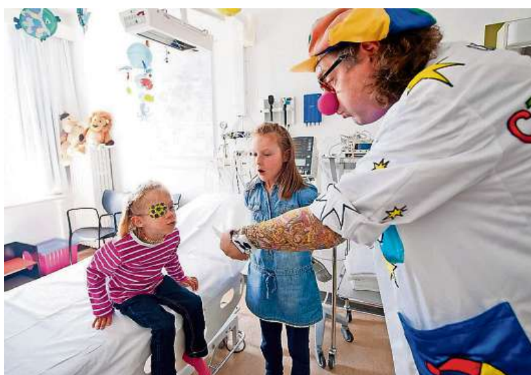
Seit 20 Jahren fester Bestandteil des Kantonsspitals: Ein Traumdoktor spielt mit hospitalisierten Kindern.

ten Kinder hätten. «Lachen entspannt und nimmt die Angst.» Für die kleinen Patienten würden die wöchentlichen Besuche der spezi-